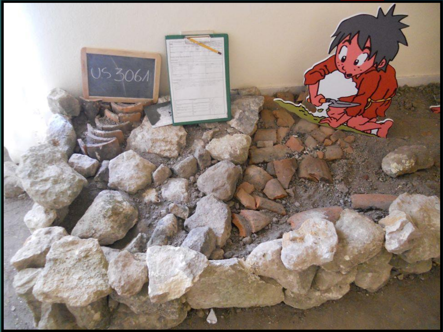
BIDDAS Museum of abandoned villages