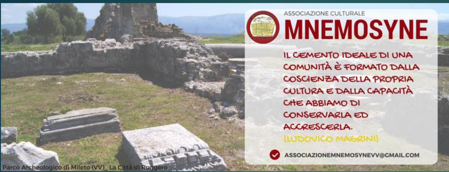
Parco Archeologico di Mileto (VV) - La Città di Ruggero